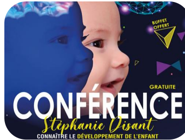
Journée Professionnelle Petite Enfance