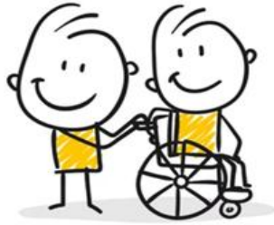
Formation à l'accueil des enfants en situation de handicap