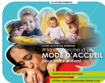
Enquête sur les modes d'accueil 0-3 ans