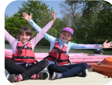
Formation « Aller vers »