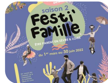
Création de Festi'famille