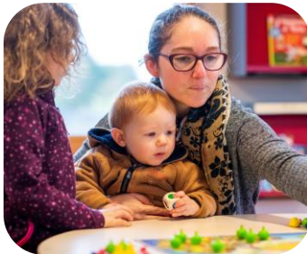
Ouverture du Lieu d'Accueil Enfants-Parents CCSL